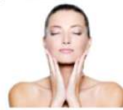
エステティックサロンカリス

まずはお顔のリフティングに効果的 な頭皮のツボや経絡を念入りにマッ サージ。更に耳のマッサージで約20 0個のツボを丹念に刺激。そして 色々な色の貴宝石&スワロフスキー を・・・